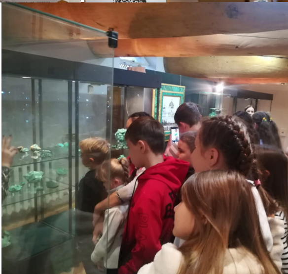
группы учеников из 5А 5Б, 5В в музее "Провиантские склады"