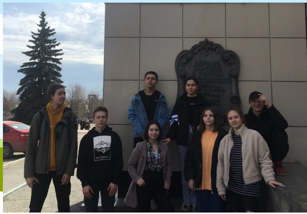
8А и 8Б классы в краеведческом музее на экскурсии "Династия Демидовых"